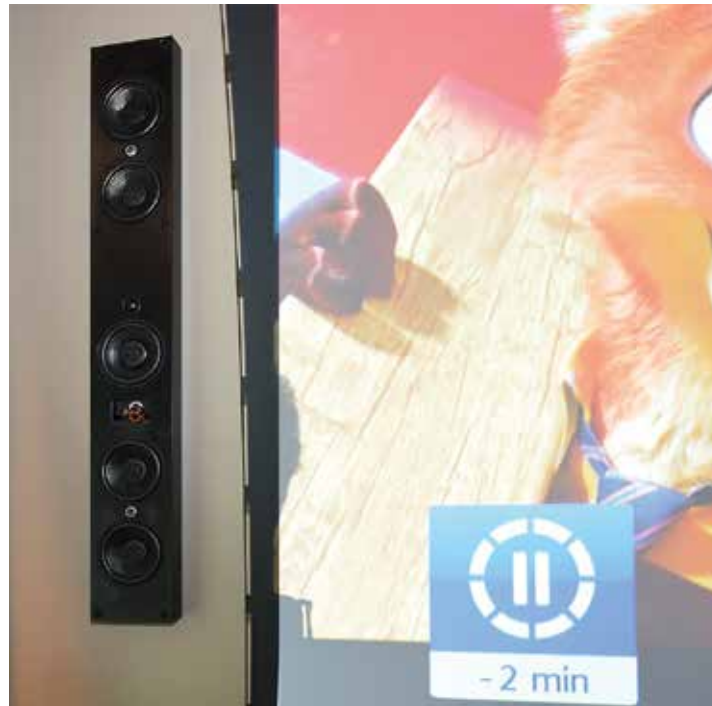
Gli altoparlanti utilizzati nella sala cinema sono dei Laboratorioaudio; sopra, un particolare di uno degli speaker; a destra, il fronte anteriore al completo, con lo schermo AdeoScreen.