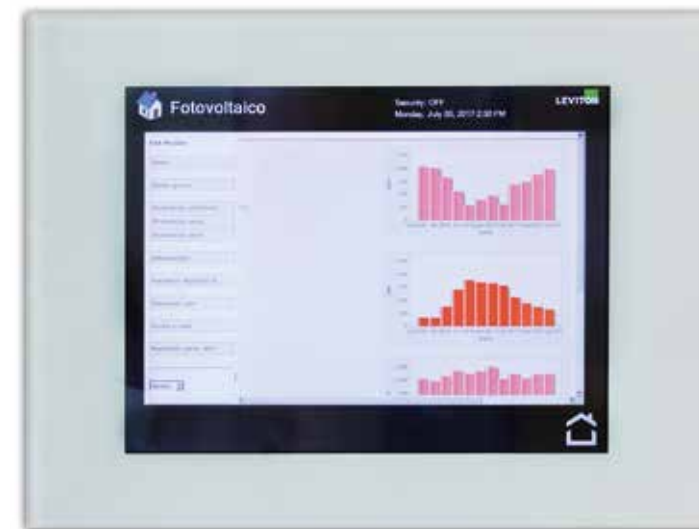
Ancora una pagina per il controllo dell'energia prodotta; i grafici rappresentano le visualizzazioni statistiche di produzione.