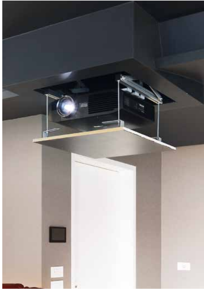
La sala cinema vede l'impiego di un vpr Panasonic PT-AE6000 installato su supporto motorizzato Screenint SI-30. Per la gestione dei segnali audio/video è utilizzato un receiver Integra DRX-7.