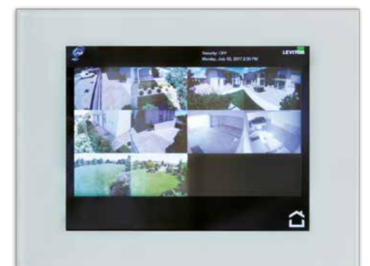
Una schermata relativa alla videosorveglianza; sono 10 le zone esterne (incluso il garage) controllate da telecamere.