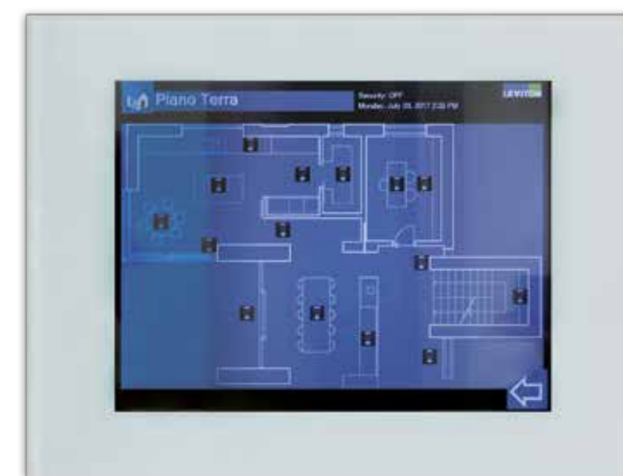
Sui touch-screen è possibile disporre della piantina dell'abitazione; sono visualizzati i vari punti luce della zona living-cucina.