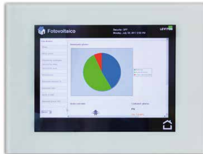
Una schermata relativa alla gestione dell'impianto fotovoltaico; il grafico rappresenta il sommario del consumo giornaliero.

video multizona e multisorgente, rete dati, WiFi professionale, gestione di matrice video con controllo delle sorgenti, TV, Video ecc. e una gestione integrale e precisa per mezzo del controller collegato a tutte le periferiche del sistema HAI Omni Pro II Leviton. La flessibilità dell'impianto ha permesso una perfetta integrazione dei sistemi proposti e di quelli forniti come "terze parti" e quindi un grado di soddisfazione del cliente finale molto alto.