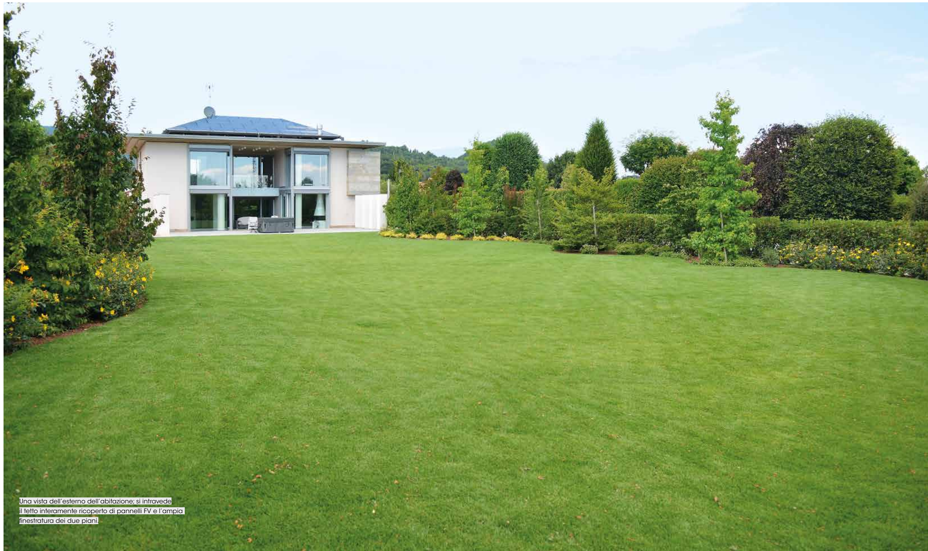
Una vista dell'esterno dell'abitazione; si intravede il tetto interamente ricoperto di pannelli FV e l'ampia finestratura dei due piani.